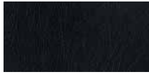
Cuir Noir (08)