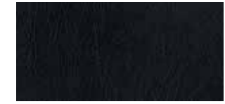
Cuir Noir (LS)