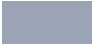
Bleu Polaire H8H8