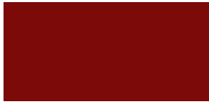
Rouge Volcan F6F6