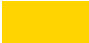
Jaune Ovni 1V1V