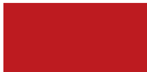
Rouge Emocion 9M9M (3)