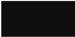
Noir Magique Z4Z4