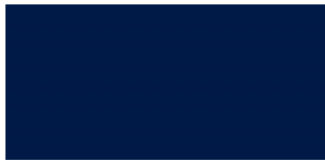
Bleu Aniversario 1G1G